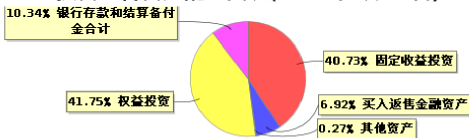
投资组合资产配置图表(2023年6月30日)