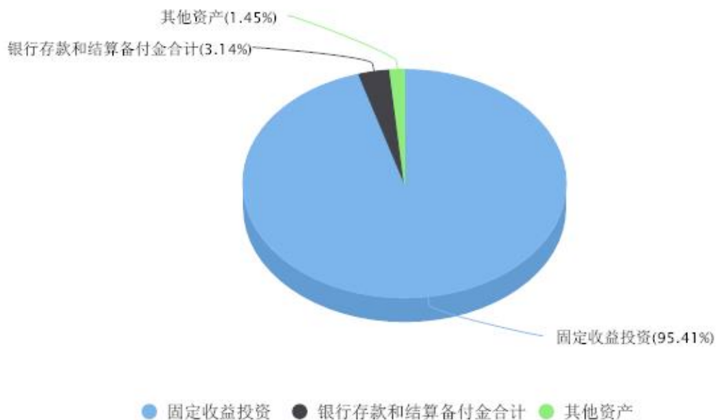
投资组合资产配置图表 数据截止日期:2023年03月31日