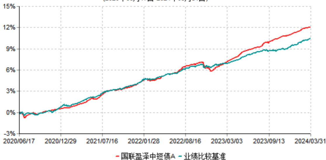
国联盈泽中短债A累计净值增长率与业绩比较基准收益率历史走势对比图 (2020年06月17日-2024年03月31日)