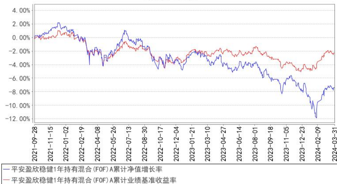
平安盈欣稳健1年持有混合（FOF）A累计净值增长率与同期业绩比较基准收益率的历史走势对比图

（二）自基金合同生效以来基金份额累计净值增长率变动及其与同期业绩比较基准收益率变动的比较