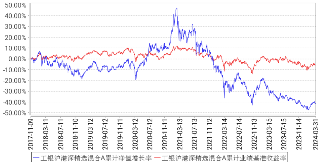
工银沪港深精选混合A累计净值增长率与同期业绩比较基准收益率的历史走势对比图