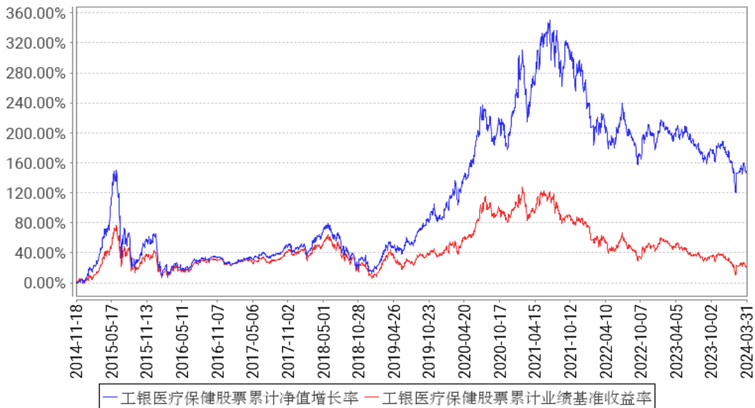
工银医疗保健股票累计净值增长率与同期业绩比较基准收益率的历史走势对比图