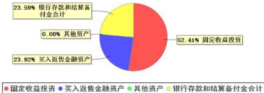
投资组合资产配置图表(2024年3月31日)