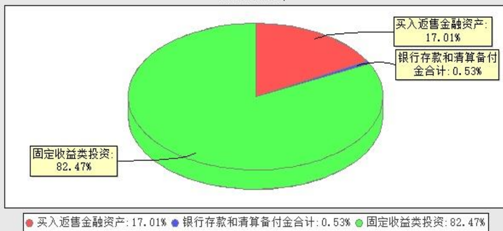
华宝浮动净值型发起式货币市场基金投资组合资产配置图表(数据截止日期: 20240331)