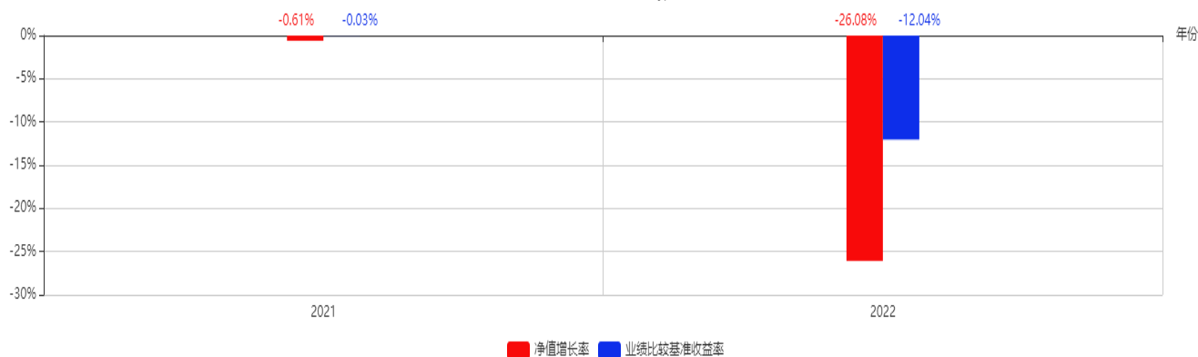
基金每年的净值增长率及与同期业绩比较基准的比较图