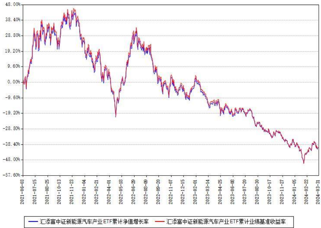
汇添富中证新能源汽车产业ETF累计净值增长率与同期业绩基准收益率对比图