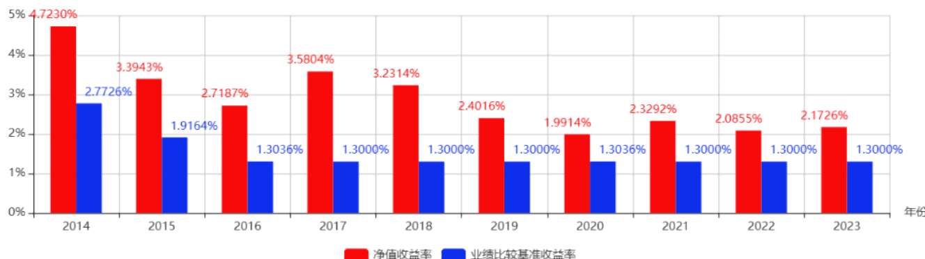
基金每年的净值收益率及与同期业绩比较基准的比较图