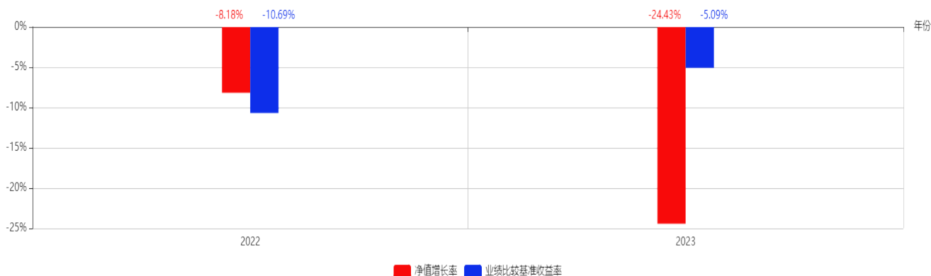
基金每年的净值增长率及与同期业绩比较基准的比较图