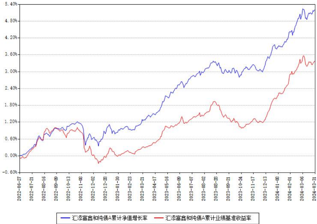
汇添富鑫和纯债A累计净值增长率与同期业绩基准收益率对比图

(二) 自基金合同生效以来基金累计净值增长率变动及其与同期业绩比较基准收益率变动的比较图