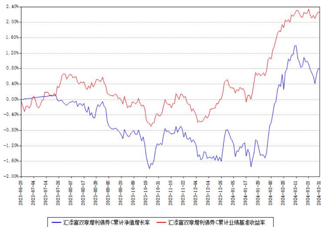
汇添富双享增利债券C累计净值增长率与同期业绩基准收益率对比图