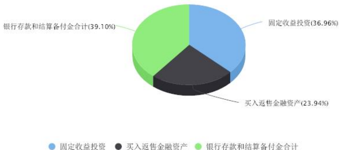
投资组合资产配置图表 数据截止日期:2023年09月30日