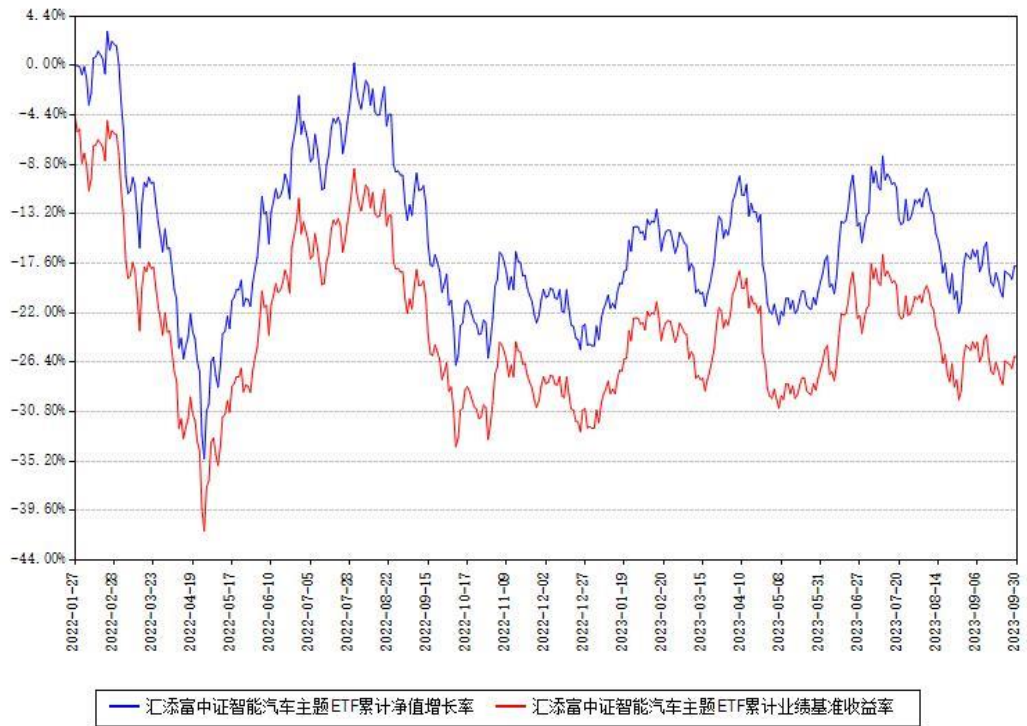
汇添富中证智能汽车主题ETF累计净值增长率与同期业绩基准收益率对比图