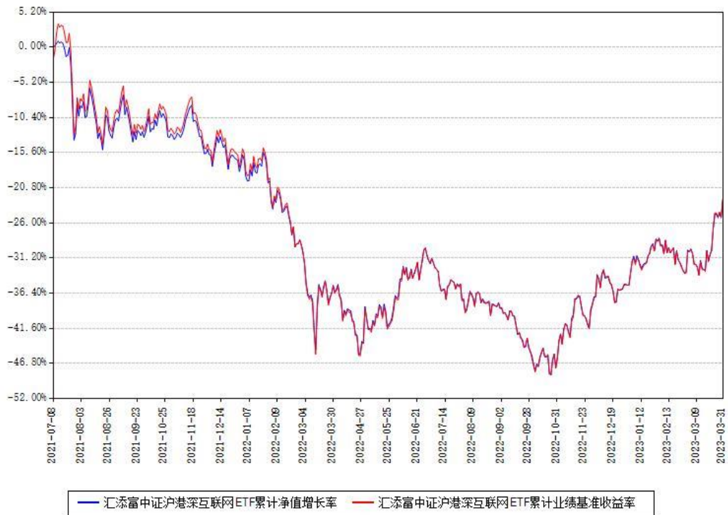
汇添富中证沪港深互联网ETF累计净值增长率与同期业绩基准收益率对比图