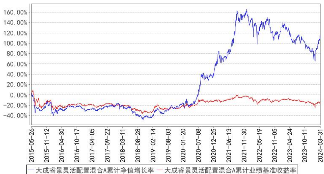
大成睿景灵活配置混合A累计净值增长率与同期业绩比较基准收益率的历史走势对比图

(二) 自基金合同生效以来基金份额累计净值增长率变动及其与同期业绩比较基准收益率变动的比较