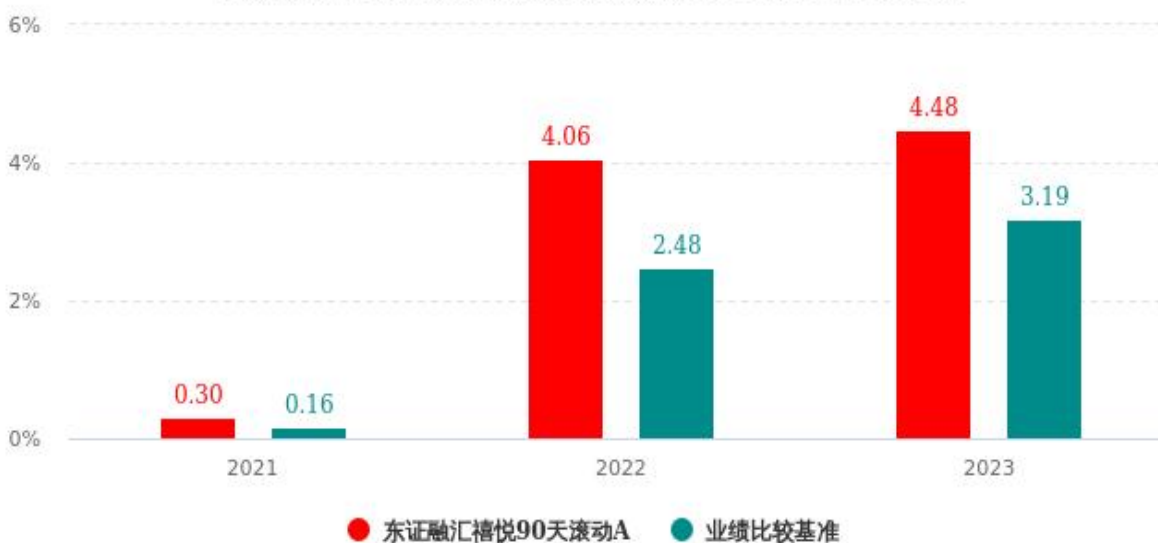
基金的过往业绩不代表未来表现，数据截止日：2023年12月31日