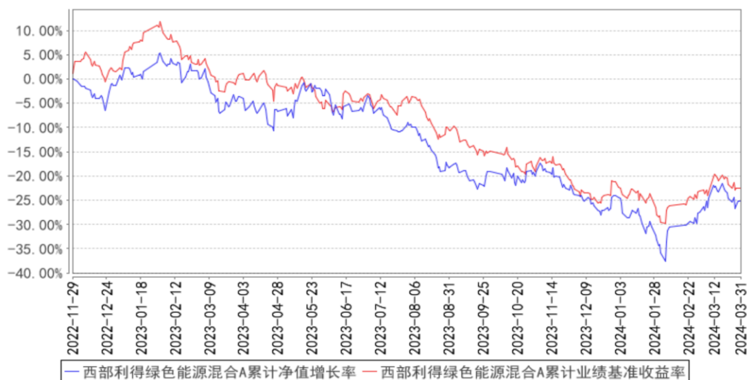
西部利得绿色能源混合A累计净值增长率与同期业绩比较基准收益率的历史走势对比图

2) 西部利得绿色能源混合型证券投资基金 C（2022 年 11 月 29 日至 2024 年 03 月 31 日）