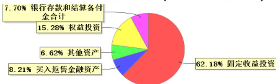
投资组合资产配置图表(2023年12月31日)

● 固定收益投资 ● 买入返售金融资产 ● 其他资产 ● 权益投资 ● 银行存款和结算备付金合计