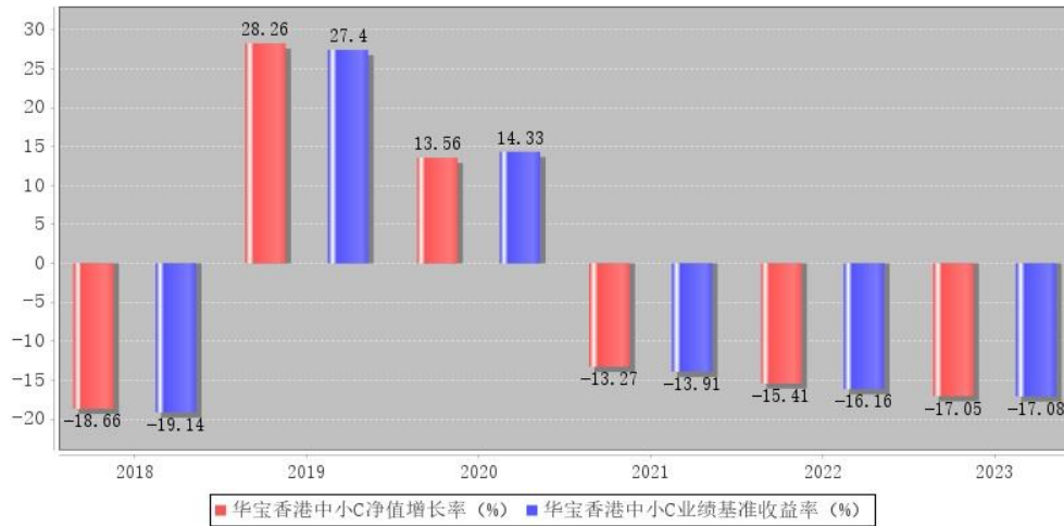
华宝香港中小C每年净值增长率与同期业绩比较基准收益率的对比图