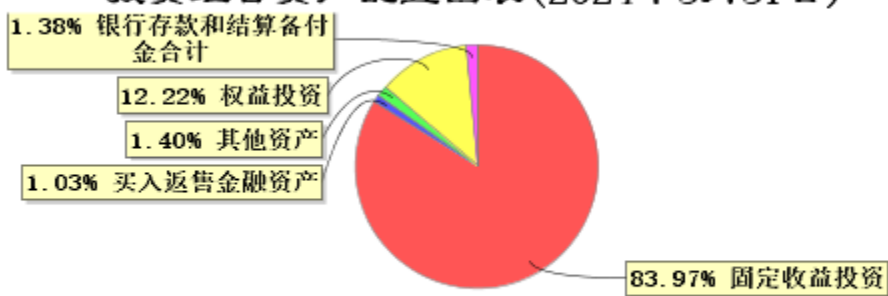
投资组合资产配置图表(2024年3月31日)

● 固定收益投资 ● 买入返售金融资产 ● 其他资产 ● 权益投资 ● 银行存款和结算备付金合计