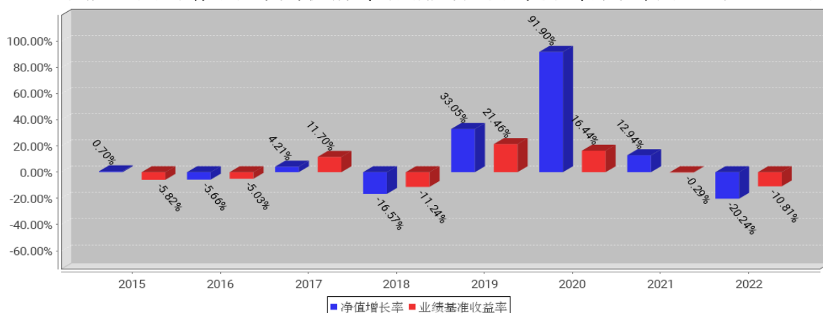
工银总回报灵活配置混合A基金每年净值增长率与同期业绩比较基准收益率的对比图（2022年12月31日）

注：1、本基金基金合同于2015年4月17日生效。合同生效当年不满完整自然年度的，按实际期限计算净值增长率。