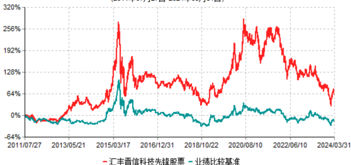
汇丰晋信科技先锋股票型证券投资基金累计净值增长率与业绩比较基准收益率历史走势对比图 (2011年07月27日-2024年03月31日)