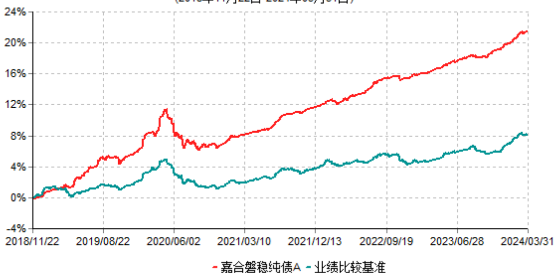
嘉合磐稳纯债A累计净值增长率与业绩比较基准收益率历史走势对比图 (2018年11月22日-2024年03月31日)