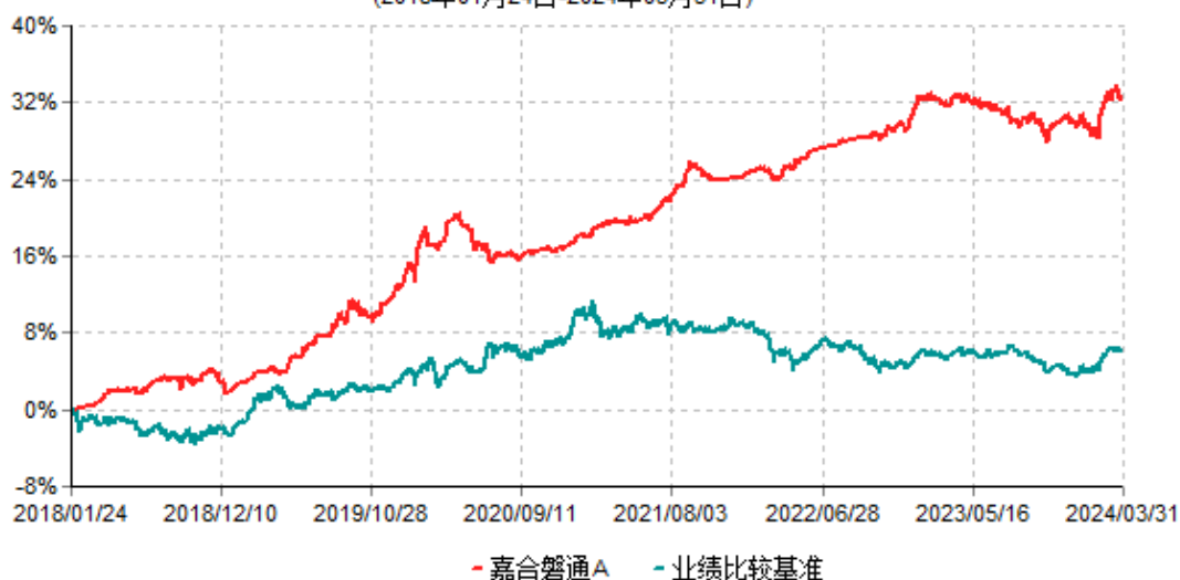
嘉合磐通A累计净值增长率与业绩比较基准收益率历史走势对比图 (2018年01月24日-2024年03月31日)

（二）自基金合同生效以来基金累计净值增长率变动及其与同期业绩比较基准收益率变动的比较