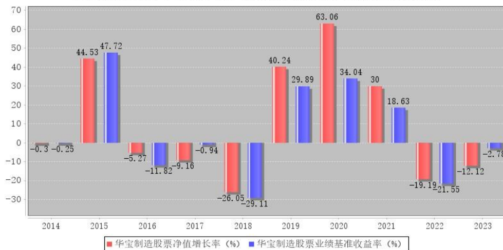
华宝制造股票每年净值增长率与同期业绩比较基准收益率的对比图