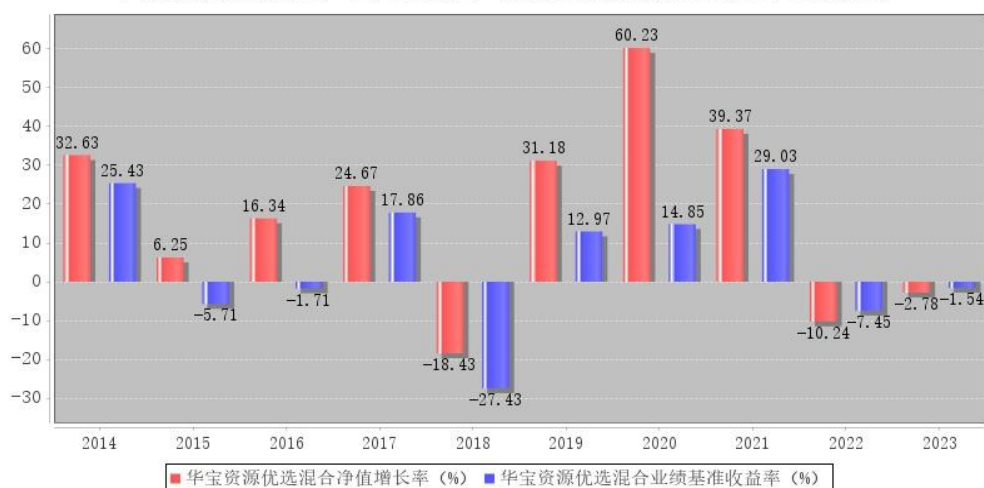
华宝资源优选混合每年净值增长率与同期业绩比较基准收益率的对比图