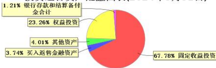
投资组合资产配置图表(2024年3月31日)

● 固定收益投资 ● 买入返售金融资产 ● 其他资产 ● 权益投资 ● 银行存款和结算备付金合计