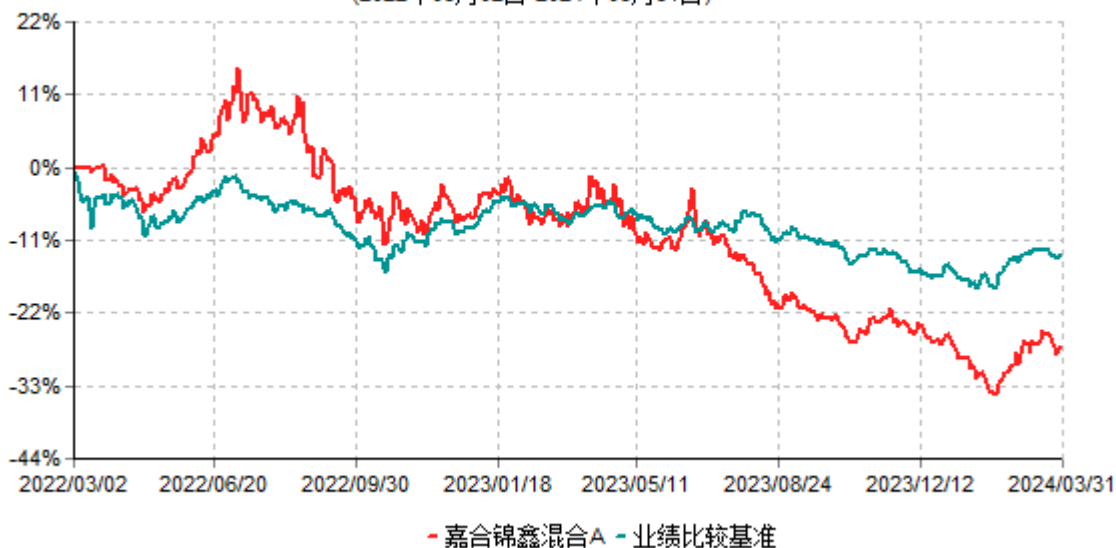
嘉合锦鑫混合A累计净值增长率与业绩比较基准收益率历史走势对比图 (2022年03月02日-2024年03月31日)