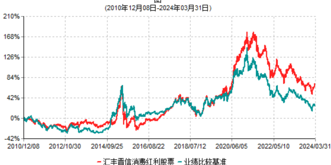
汇丰晋信消费红利股票型证券投资基金累计净值增长率与业绩比较基准收益率历史走势对比图

注：1. 按照基金合同的约定，本基金的投资组合比例为：股票投资比例范围为基金资产的 85%-95%，权证投资比例范围为基金资产净值的 0%-3%。固定收益类证券、现金和其他资产投资比例范围为基金资产的 5%-15%，其中现金（不包括结算备付金、存出保证金、应收申购款等）或到期日在一年以内的政府债券的投资比例不低于基金资产净值的 5%。按照基金合同的约定，本基金自基金合同生效日起不超过 6 个月内完成建仓，截止 2011 年 6 月 8 日，本基金的各项投资比例已达到基金合同约定的比例。