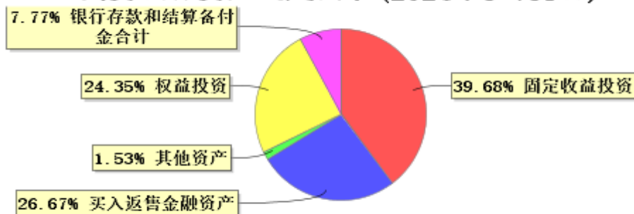
投资组合资产配置图表 (2024年3月31日)

● 固定收益投资 ● 买入返售金融资产 ● 其他资产 ● 权益投资 ● 银行存款和结算备付金合计