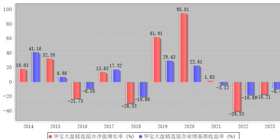
华宝大盘精选混合每年净值增长率与同期业绩比较基准收益率的对比图