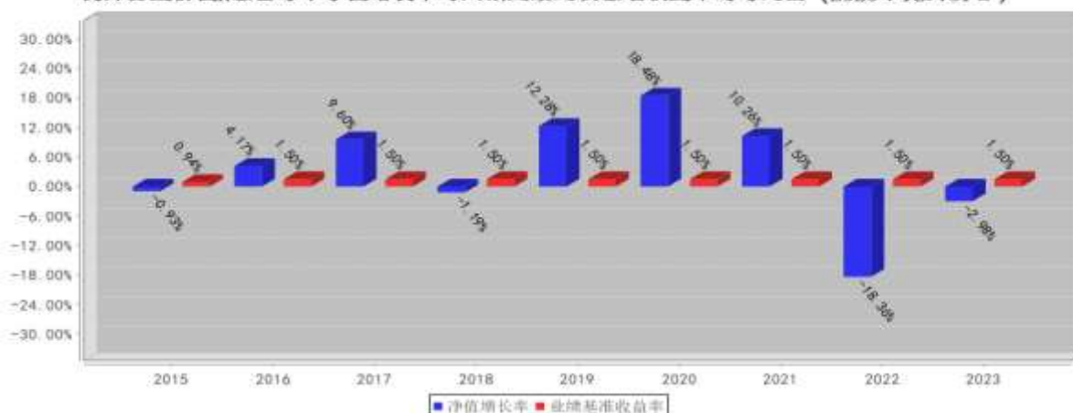
德邦鑫星价值A基金每年净值增长率与同期业绩比较基准收益率的对比图 (2023年12月31日)

注：1. 基金合同生效当年按实际期限计算，不按整个自然年度折算。 2. 基金过往业绩不代表未来表现。