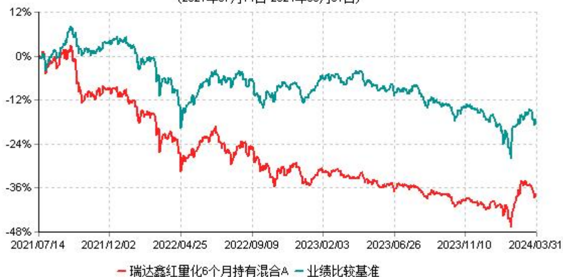
瑞达鑫红量化6个月持有混合A累计净值增长率与业绩比较基准收益率历史走势对比图 (2021年07月14日-2024年03月31日)