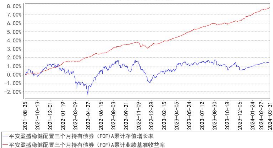
平安盈盛稳健配置三个月持有债券（FOF）A累计净值增长率与同期业绩比较基准收益率的历史走势对比图