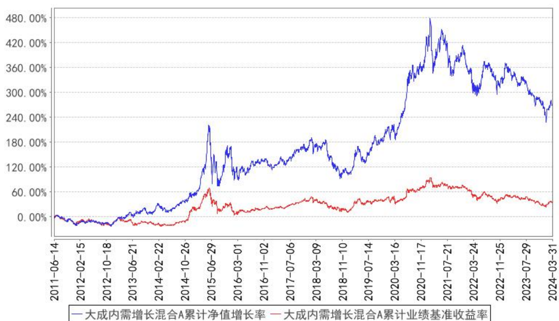
大成内需增长混合A累计净值增长率与同期业绩比较基准收益率的历史走势对比图

(二) 自基金合同生效以来基金份额累计净值增长率变动及其与同期业绩比较基准收益率变动的比较