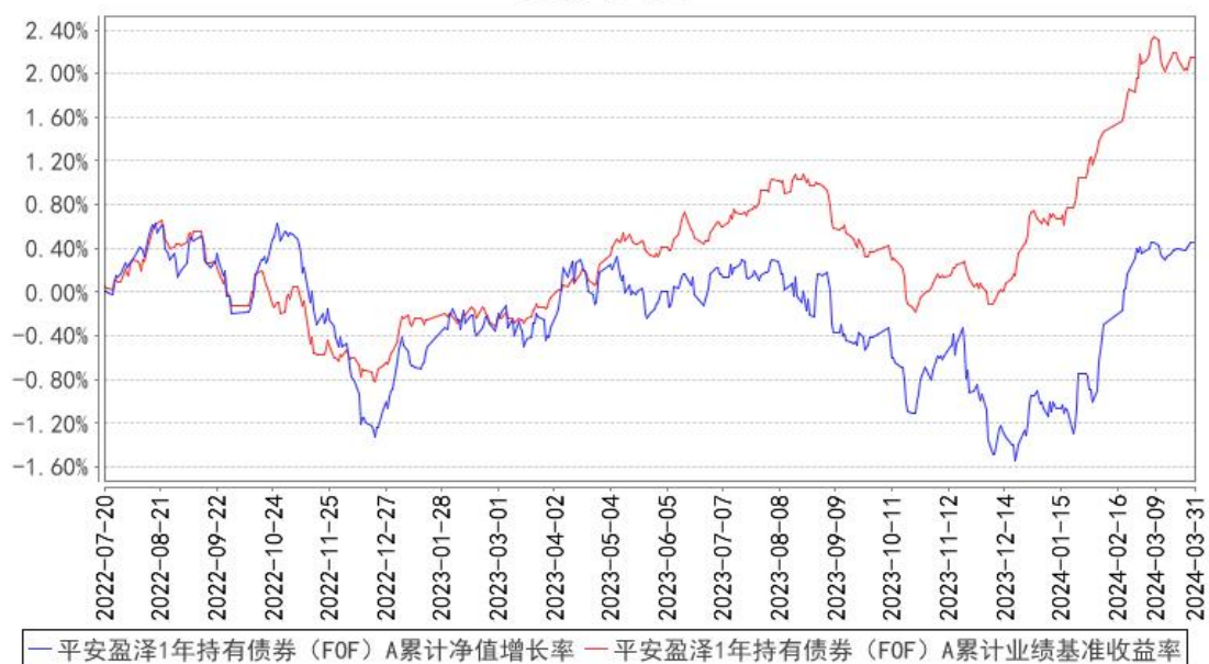
平安盈泽1年持有债券（FOF）A累计净值增长率与同期业绩比较基准收益率的历史走势对比图