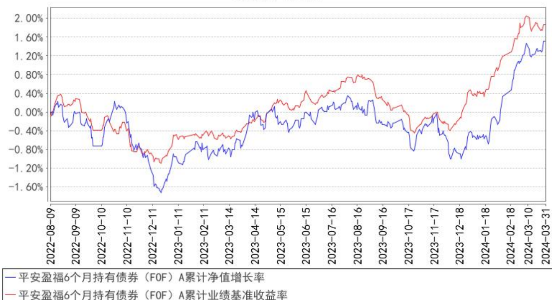
平安盈福6个月持有债券（FOF）A累计净值增长率与同期业绩比较基准收益率的历史走势对比图