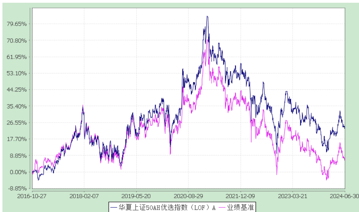
华夏上证 50AH 优选指数 C: