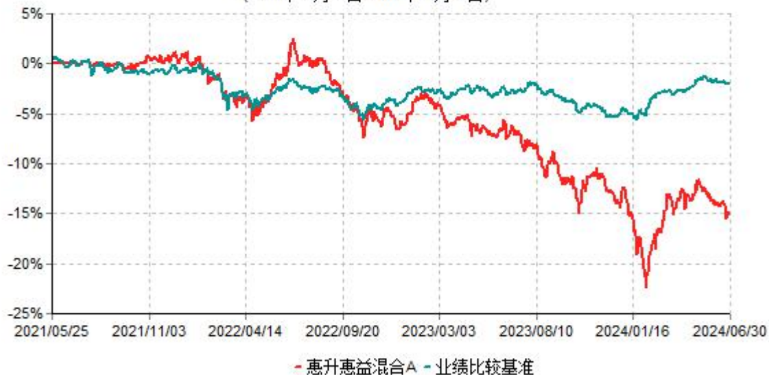
惠升惠益混合A累计净值增长率与业绩比较基准收益率历史走势对比图 (2021年05月25日-2024年06月30日)