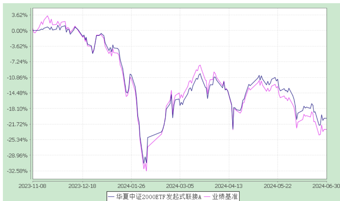
华夏中证 2000ETF 发起式联接 C: