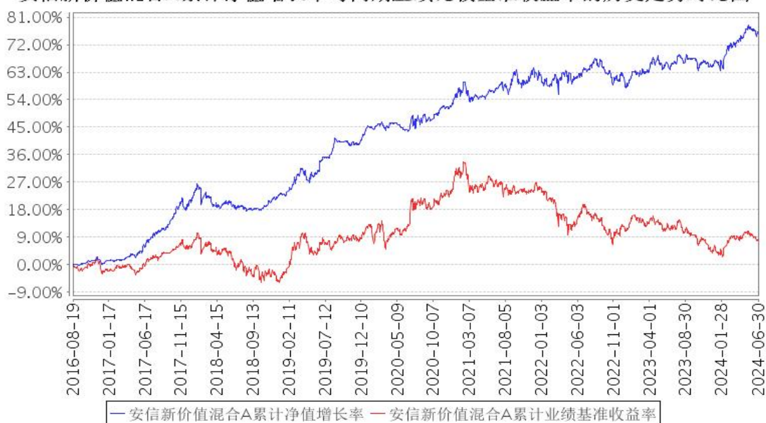
安信新价值混合A累计净值增长率与同期业绩比较基准收益率的历史走势对比图