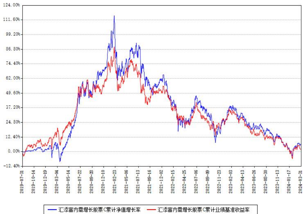
汇添富内需增长股票C累计净值增长率与同期业绩基准收益率对比图