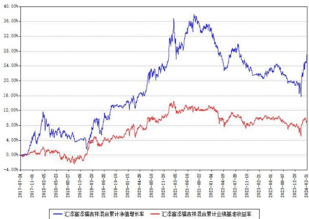
汇添富添福吉祥混合累计净值增长率与同期业绩基准收益率对比图