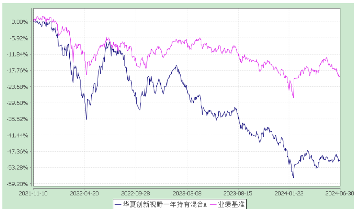
华夏创新视野一年持有混合 C: