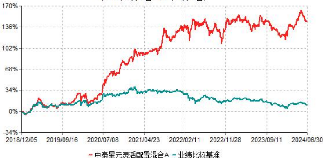
中泰星元灵活配置混合A累计净值增长率与业绩比较基准收益率历史走势对比图 (2018年12月05日-2024年06月30日)