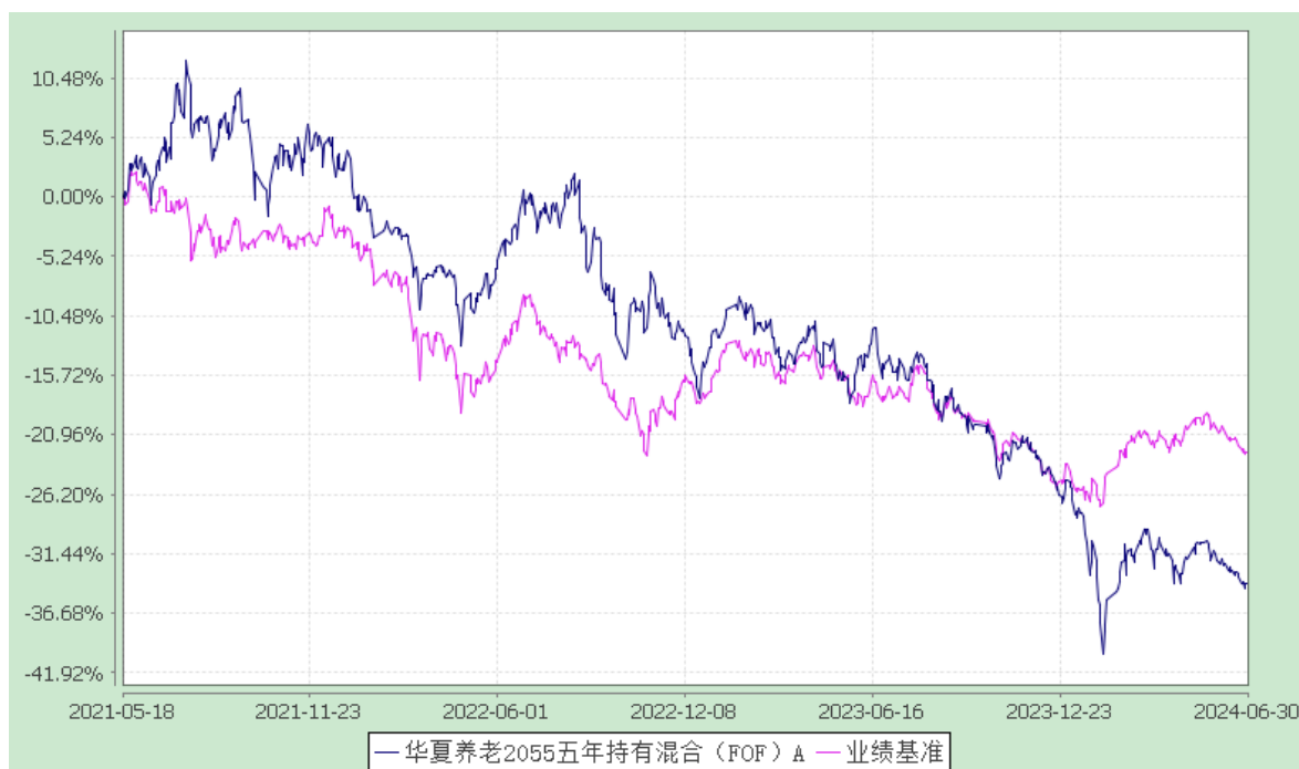
华夏养老 2055 五年持有混合（FOF）Y：