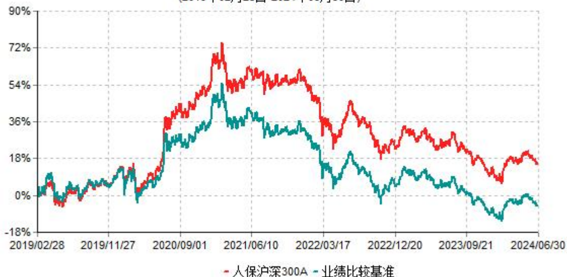
人保沪深300A累计净值增长率与业绩比较基准收益率历史走势对比图 (2019年02月28日-2024年06月30日)